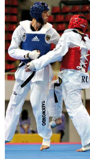
Taekwondoverein Swisttal e.V., Preisträger 2010