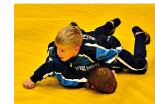
Die Rollikids aus Hennef vom Deutschen Rollstuhl-Sportverband e.V. (DRS), Preisträger 2012